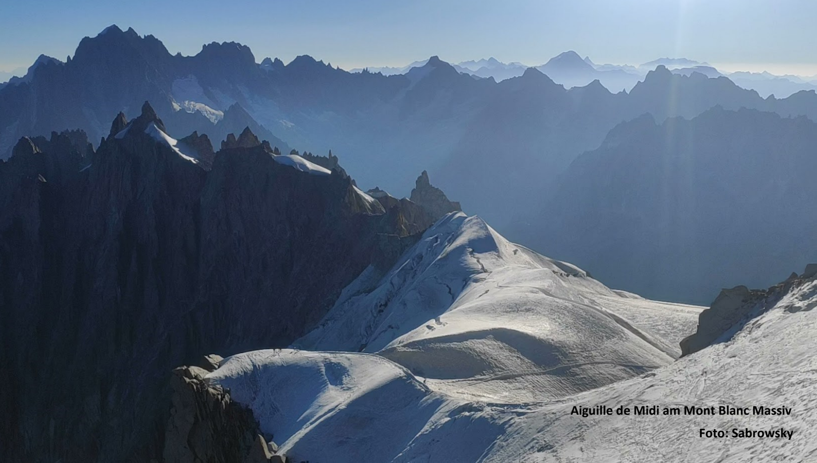
Aiguille de Midi am Mont Blanc Massiv