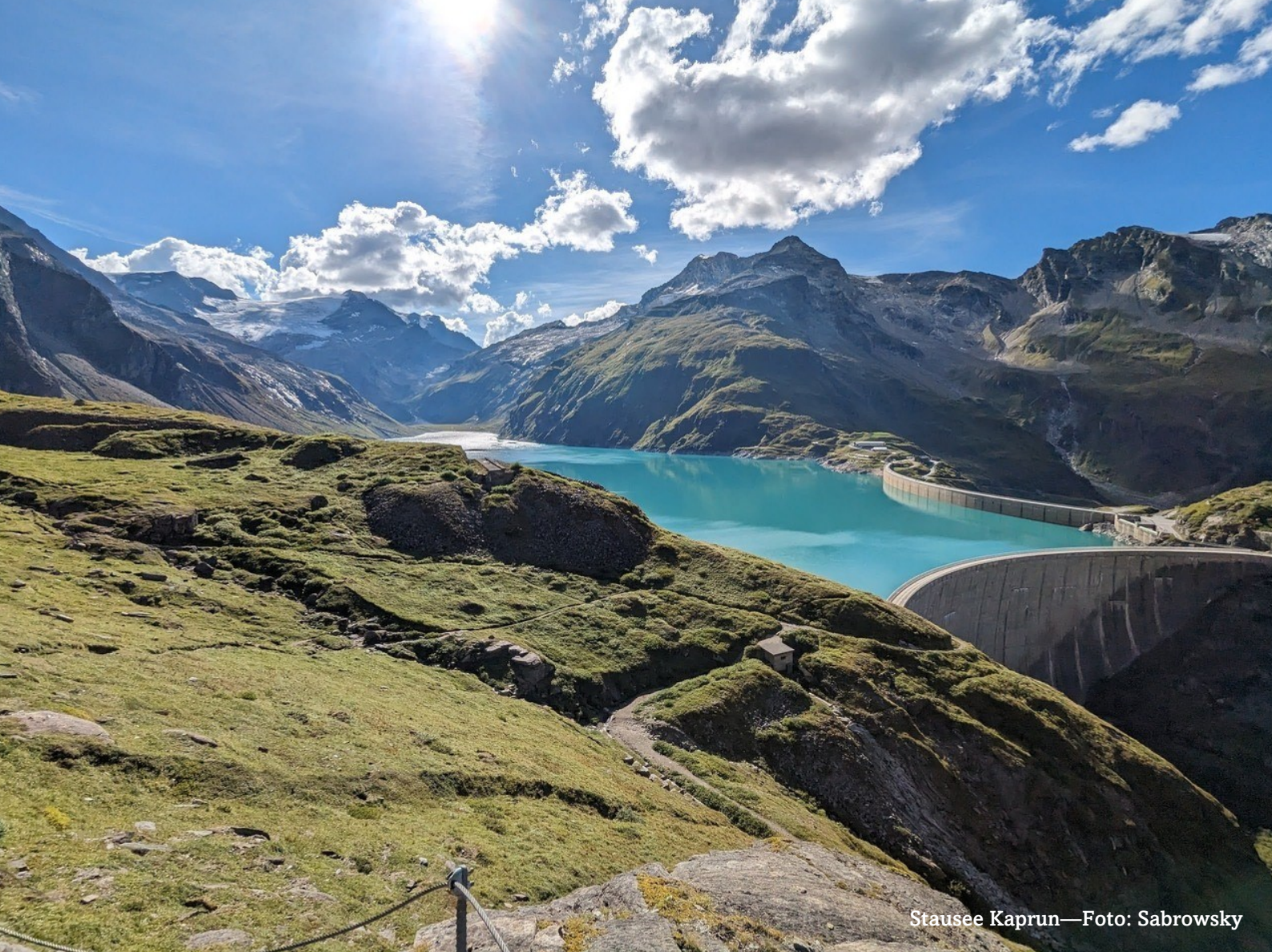
Stausee Kaprun